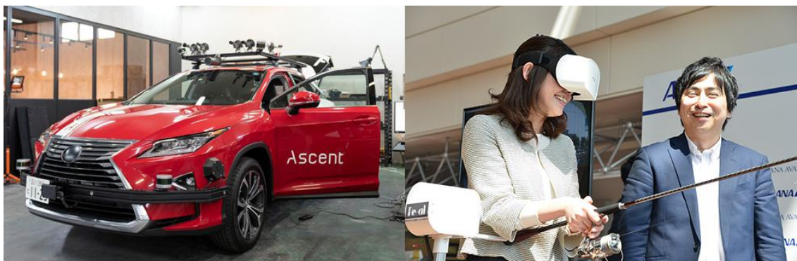
左がアセントロボティクスの自動運転 AI 搭載車。エッジコンピューティング環境下でどのように動くのかその場で体験できる。右は Re-al が開発した Real AVATAR による「遠隔釣りシステム」