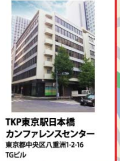
TKP東京駅日本橋 カンファレンスセンター 東京都中央区八重洲1-2-16 TGビル

ビル裏手の出入り口より参入り いただくと別館です (注) 喫煙所は1階にあります